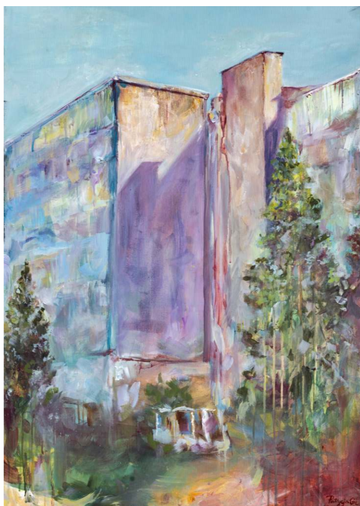
Patrycja Gil, akryl na płótnie, 50 × 70 cm, 2023