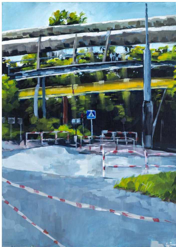
Emilia Jawura, akryl na płótnie, 50 × 70 cm, 2023