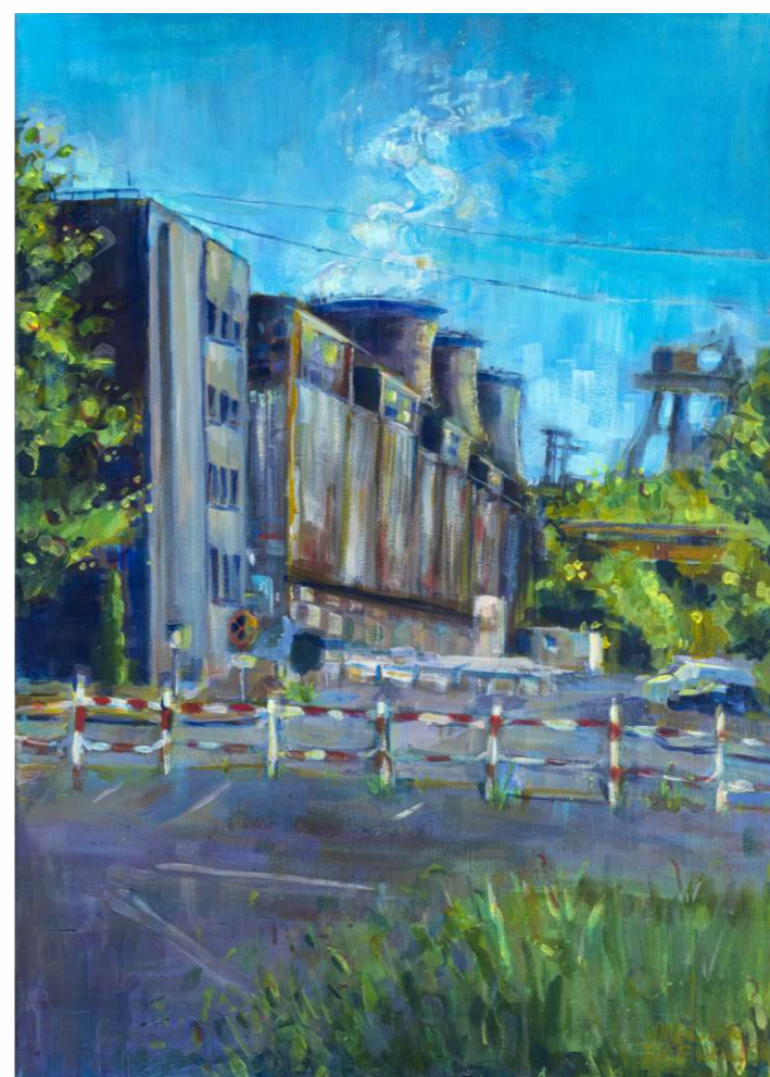
Jagoda Dąbrowska, akryl na płótnie, 50 × 70 cm, 2023