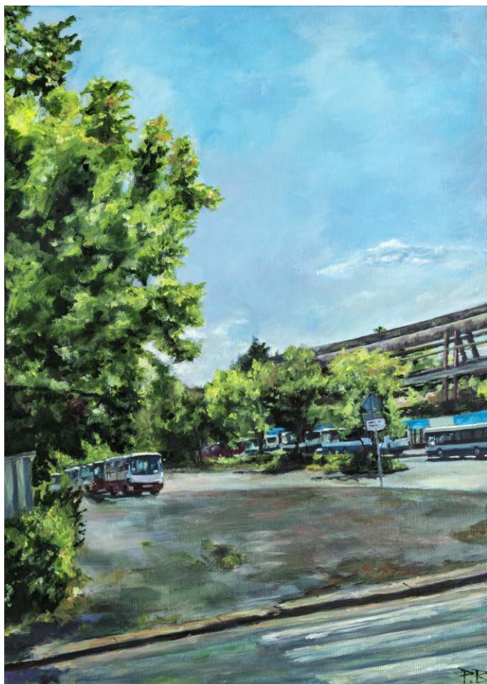
Paula Buras, akryl na płótnie, 50 × 70 cm, 2023