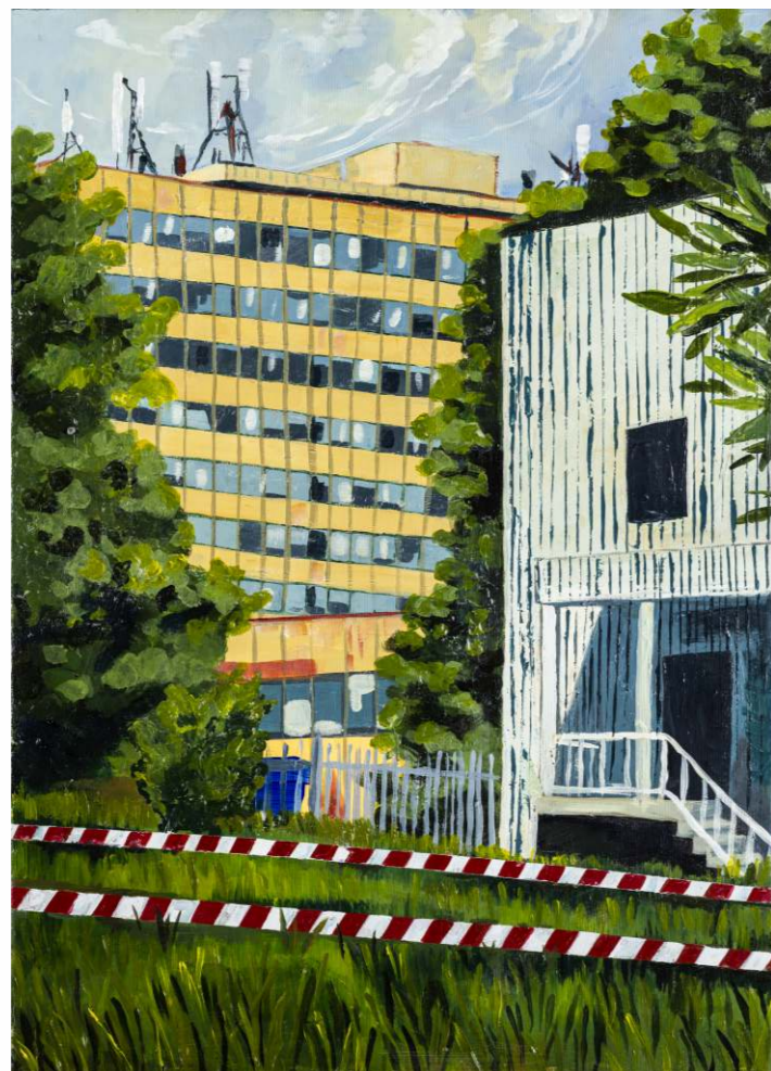
Oliwia Kozłowska, akryl na płótnie, 50 × 70 cm, 2023