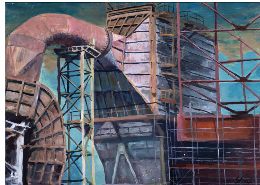
Kacper Straś, akryl na płótnie, 70 × 50 cm, 2023; praca zamieszczona na okładce broszury