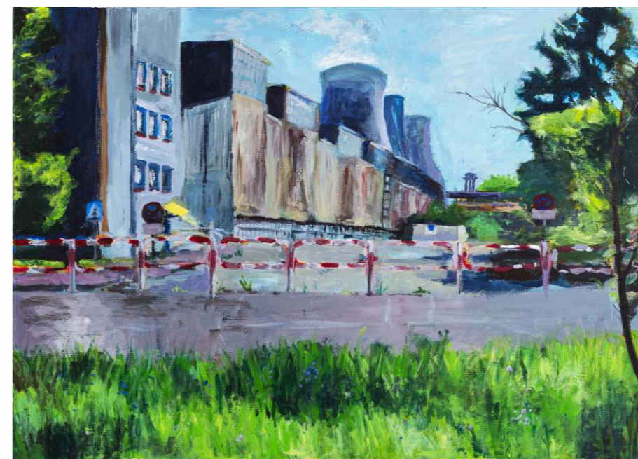
Angelika Duma, akryl na płótnie, 70 × 50 cm, 2023