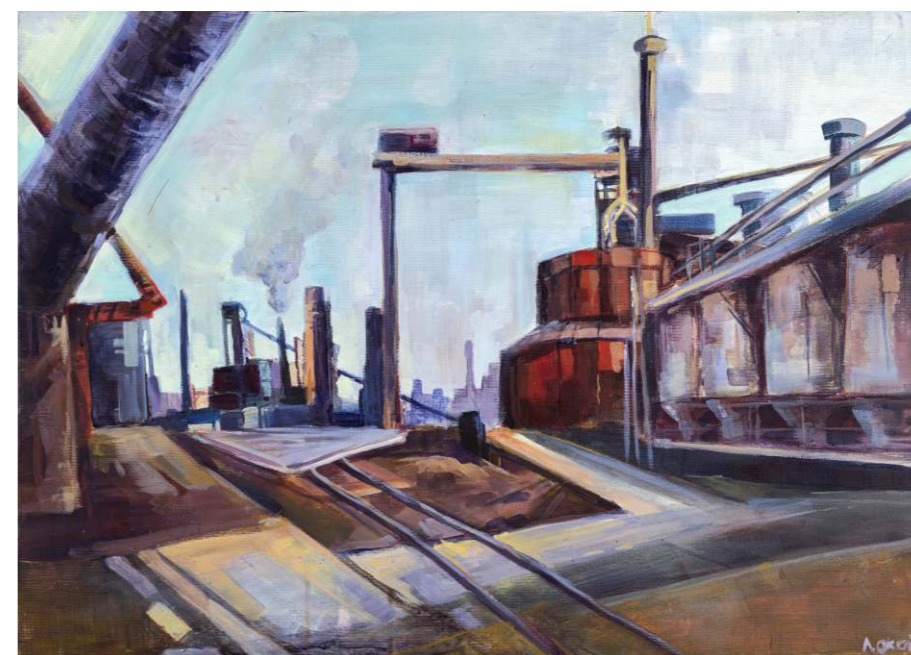
Aleksandra Okoń, akryl na płótnie, 70 × 50 cm, 2023

Tradycją w Liceum Sztuk Plastycznych są coroczne plenery wyjazdowe. Udało nam się studiować pejzaże nadmorskie, górskie, płaskowyże w kraju i za granicą. Nie gardzimy też możliwością malowania widoków industrialnych – ostatni plener odbył się na terenie Huty Katowice. Praca poza szkolną pracownią, bez ścisłego nadzoru, zahaczania sztalugą o martwą naturę i sprzęt ma dodatkowy walor edukacyjny, każe zmierzyć się z przestrzenią i zmiennymi warunkami atmosferycznymi, zmusza do samodzielnego znalezienia motywu. A wieczorami, ze świadomością, że nie czeka na nas żaden sprawdzian ani zadanie domowe, można nie tylko cieszyć się swoją obecnością ale i prowadzić z pasją dyskusje o sztuce, konfrontować się z przekonaniami kolegów i nauczycieli. Same plusy.