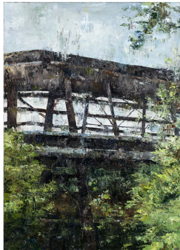
Magdalena Jurczak, olej na płótnie, 50 × 70 cm, 2023